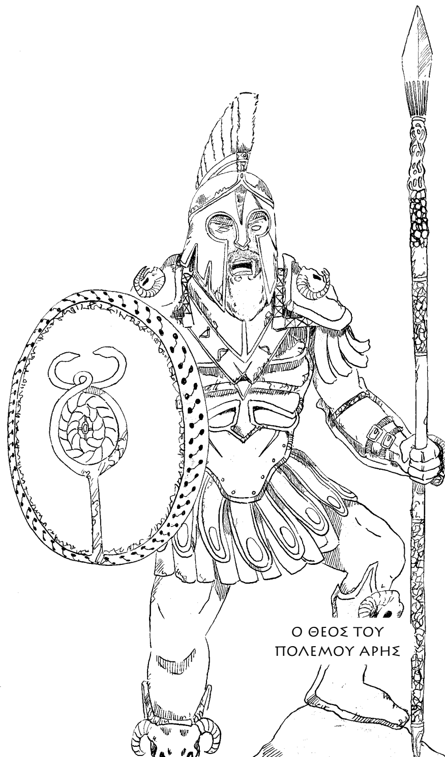
Ο ΘΕΟΣ ΤΟΥ ΠΟΛΕΜΟΥ ΑΡΗΣ

-Θυσιάστηκε για να μας δώσει ελπίδα και δύναμη να συνεχίσουμε να πολεμάμε! Εμείς, το μόνο που πρέπει να κάνουμε για